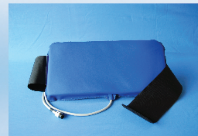
Aplicator pentru Sold masura 21x41 cm

Aparatul este livrat cu patru solenoizi ovali si la cerere pot fi furnizati diversi solenoizi ergonomici.