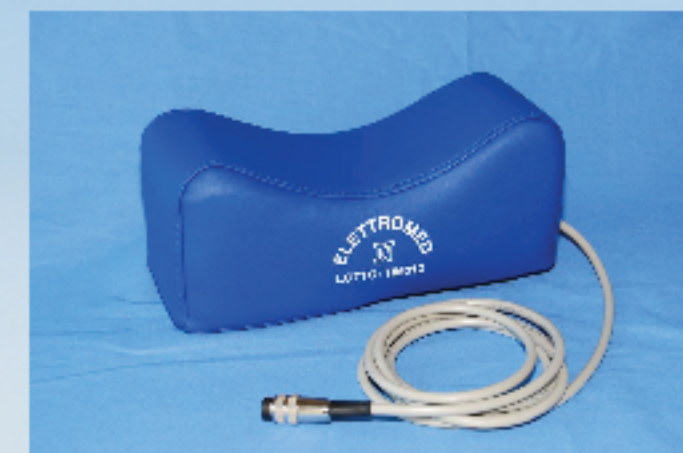
Aplicator Cervical masura 26 x12x12 cm