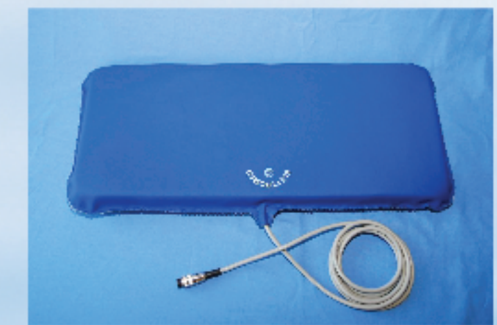
Aplicator pentru Coloana masura 63x27 cm