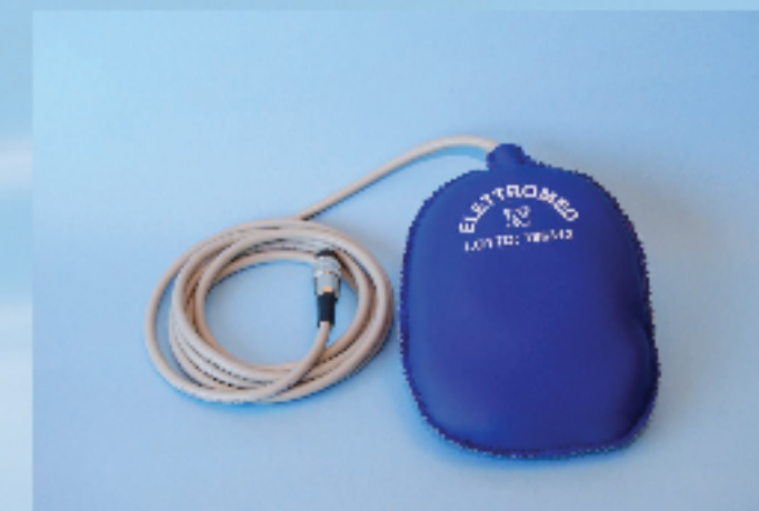
Aplicator Oval masura 20x15 cm